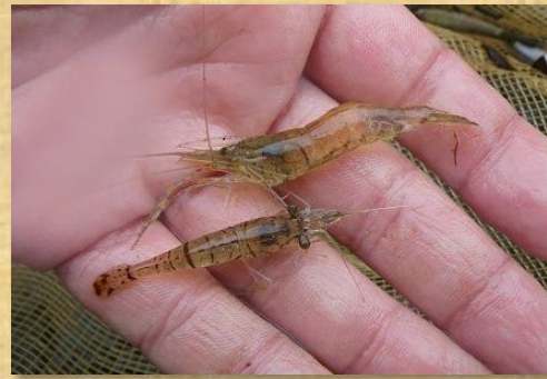
テナガエビ(上)とスジエビ(下)

今年度のバスターズでは、定置網で多くの小魚やエビ類を観察することができました。これらの生き物が増えてきたということは、駆除活動の成果のあらわれであり、バス駆除が着実に進んでいることを意味します。今後もバス・ギルの繁殖抑制を徹底すれば、さらに生き物豊かな伊豆沼・内沼が戻ってくると思います。