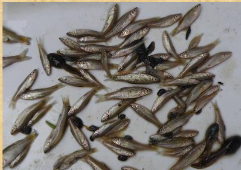
モツゴやタモロコの稚魚